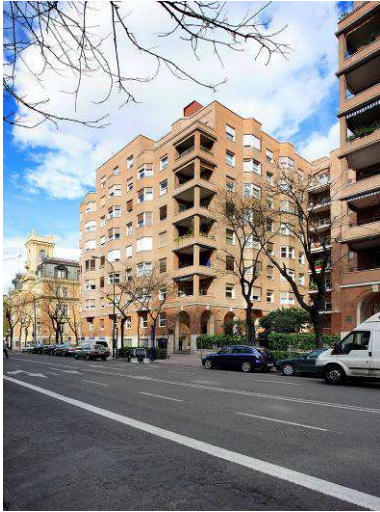
RRG_V_MA_A10_2 contenido: vista exterior fecha de realización: 10/2008