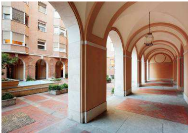
RRG_V_MA_A10_26 contenido: vista exterior fecha de realización: 10/2008