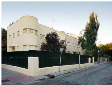
RRG_V_MA_A05_10 contenido: vista exterior fecha de realización: 09/2008