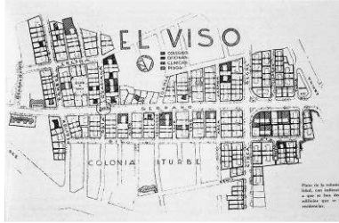
RRG_V_MA_A05_5 contenido: planta general