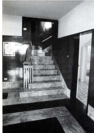
RRG_V_ISLASCA_A12_9 contenido: vista exterior fecha de realización: 2002