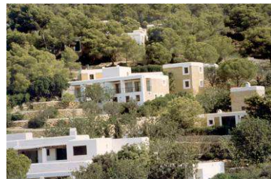
RRG_V_ISLAS_BA_A19_26 contenido: vista exterior general fecha de realización: 09/2008