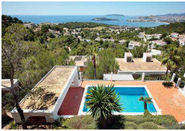
RRG_V_ISLAS_BA_A19_11 contenido: vista exterior casa Francisco Sert fecha de realización: 09/2008