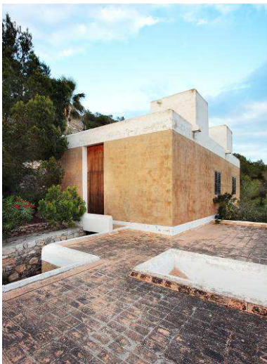
RRG_V_ISLAS_BA_A19_13 contenido: vista exterior casa Zao-Wo-Ki fecha de realización: 09/2008