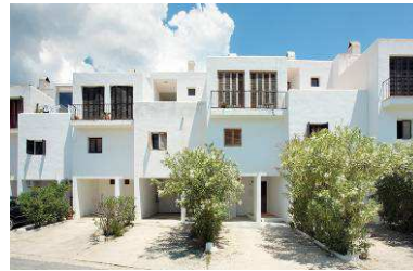
RRG_V_ISLAS_BA_A19_15 contenido: vista exterior casa apartamentos Els Fumerals fecha de realización: 09/2008