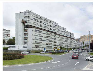
RRG_V_GA_A28_8 contenido: vista exterior fecha de realización: 2009