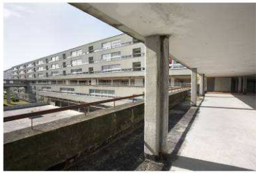
RRG_V_GA_A28_7 contenido: vista exterior fecha de realización: 2009