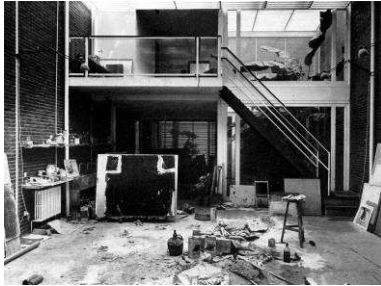
RRG_V_CAT_A44_2 contenido: vista interior  fecha de realización: