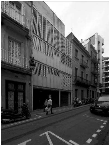
RRG_V_CAT_A44_10 contenido: vista exterior fecha de realización: 2007