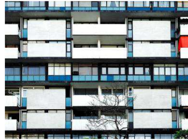
RRG_V_CAT_A41_6 contenido: vista exterior fecha de realización: 2008