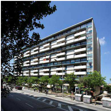
RRG_V_CAT_A41_5 contenido: vista exterior fecha de realización: 2008