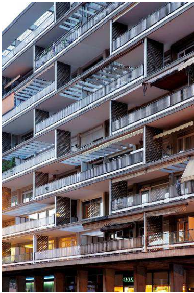
RRG_V_CAT_A26_3 contenido: vista exterior fecha de realización: 2008