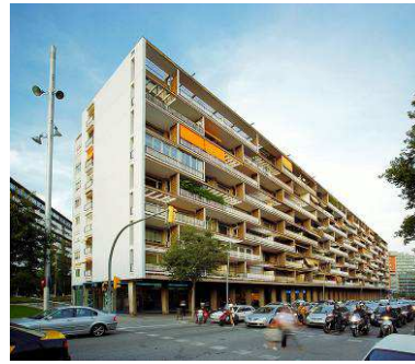
RRG_V_CAT_A26_4 contenido: vista exterior fecha de realización: 2008