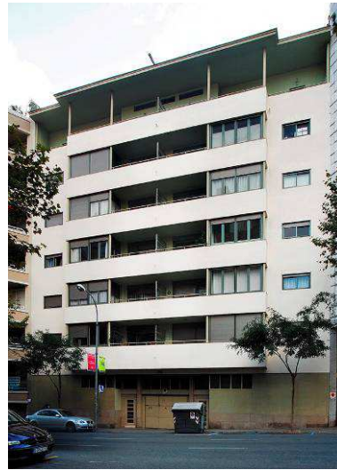
RRG_V_CAT_A10_5 contenido: vista exterior fecha de realización: 2008