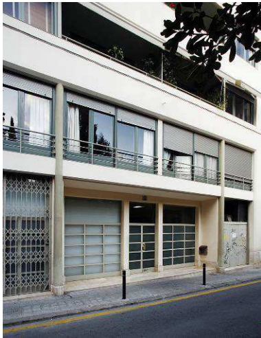
RRG_V_CAT_A10_3 contenido: vista exterior fecha de realización: 2008