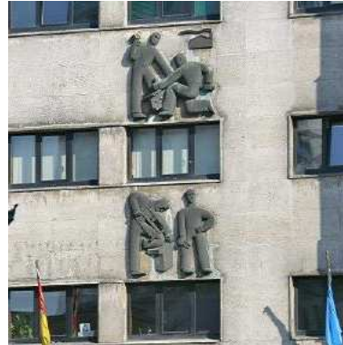
RRG_V_AST_A01_13 contenido: vista exterior, detalle bajo relieve fecha de realización: marzo de 2008