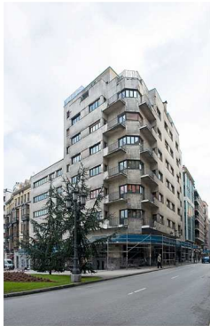
RRG_V_AST_A01_01 contenido: vista exterior fecha de realización: marzo de 2008