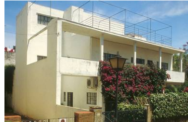
RRG_V_AND_OCC_A01_16 contenido: vista exterior fecha de realización: