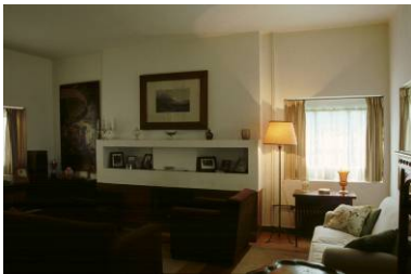
RRG_V_AND_OCC_A01_10 contenido: vista interior fecha de realización: