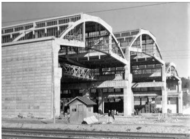
RRG_I_AST_A07_3_2a contenido: vista exterior fecha de realización: 1959