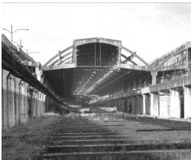
RRG_I_AST_A07_3_3a contenido: vista del parque de laminado fecha de realización: 2000