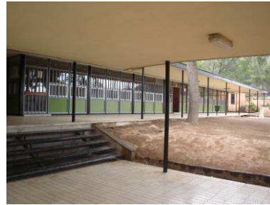
RRG_E_VA_A36_06 contenido: vista exterior fecha de realización: 25 de febrero de 2009