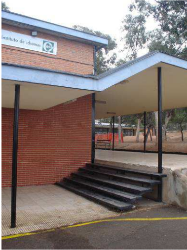
RRG_E_VA_A36_03 contenido: vista exterior fecha de realización: 25 de febrero de 2009