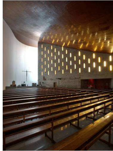
RRG_E_PV_A15_04 contenido: vista interior fecha de realización: 07/2008