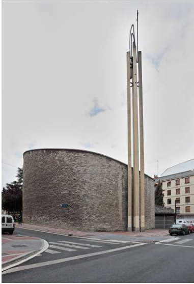
RRG_E_PV_A15_02 contenido: vista exterior fecha de realización: 07/2008