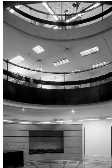
RRG_E_MA_A13_02 contenido: vista interior fecha de realización: 1980