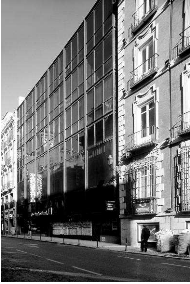
RRG_E_MA_A13_01 contenido: vista exterior fecha de realización: 1980