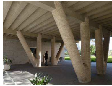
RRG_E_MA_A11_39 contenido: vista exterior fecha de realización: 2013