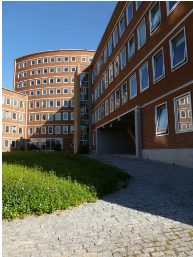
RRG_E_MA_A11_45 contenido: vista exterior fecha de realización: 2013