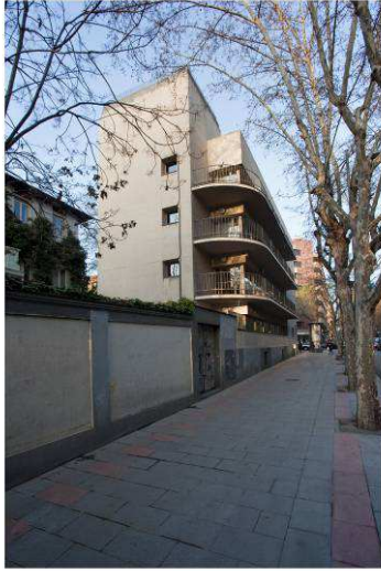
RRG_E_MA_A01_1 contenido: vista exterior fecha de realización: 04/2010