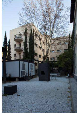
RRG_E_MA_A01_2 contenido: vista exterior fecha de realización: 04/2010