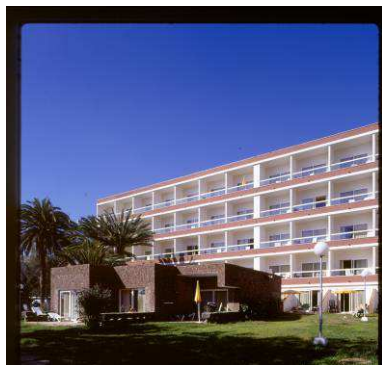
RRG_E_ISLAS_CA_A17_06 contenido: vista exterior fecha de realización: 2002