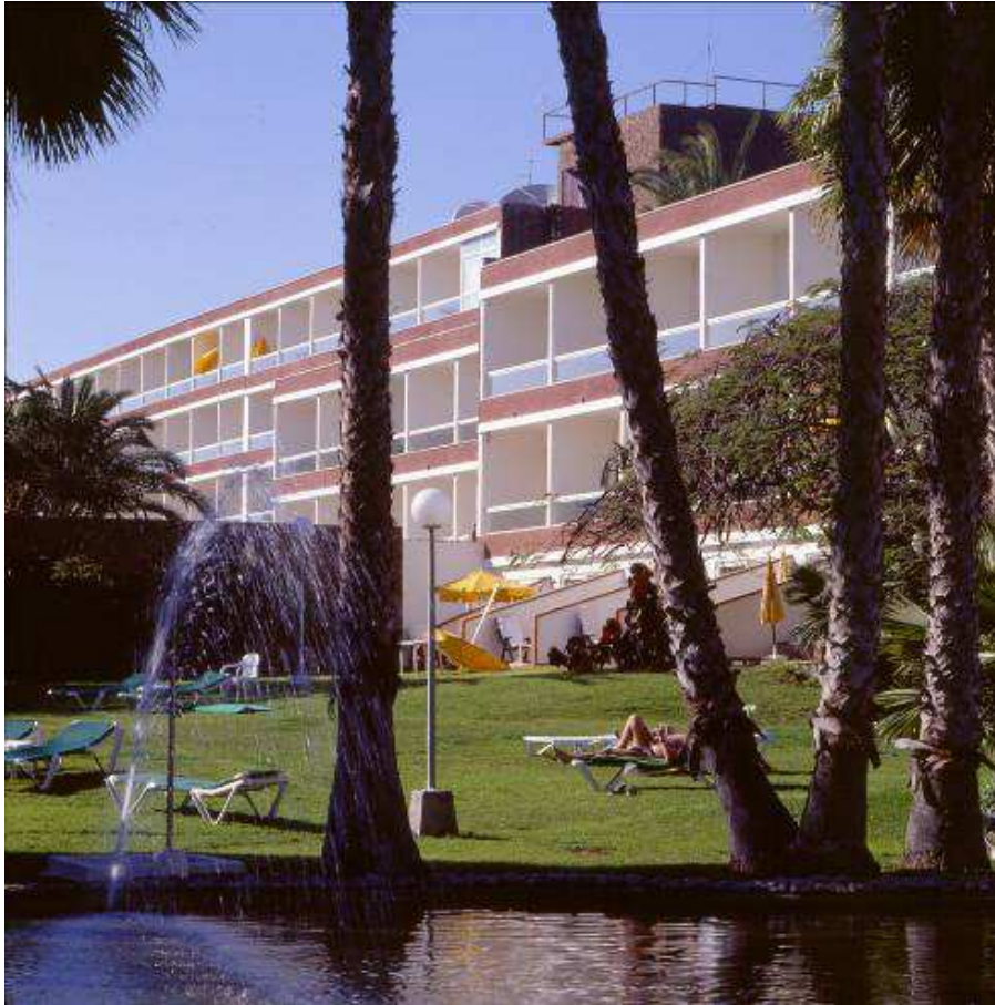
fecha de realización de la fotografía: 2002