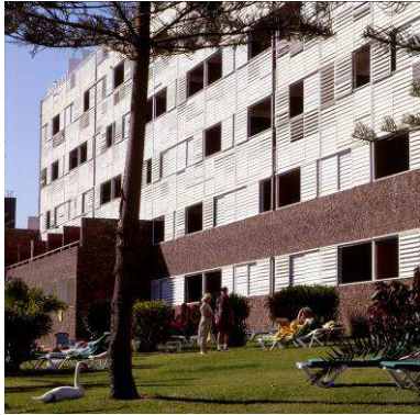
RRG_E_ISLAS_CA_A17_02 contenido: vista exterior fecha de realización: 2002