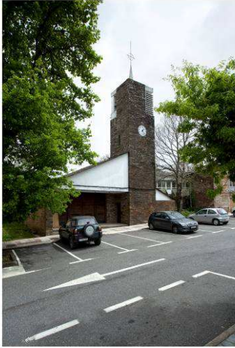
RRG_E_GA_A16_01 contenido: vista exterior fecha de realización: 2010