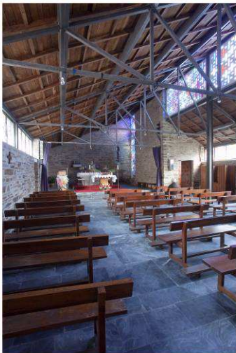
RRG_E_GA_A16_25 contenido: vista interior fecha de realización: 2010