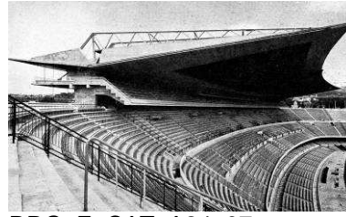
RRG_E_CAT_A24_07 contenido: vista exterior del estadio original fecha de realización: ca. 1958