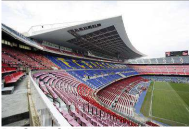
RRG_E_CAT_A24_02 contenido: vista exterior del estadio con la ampliación de las gradas fecha de realización: 2007