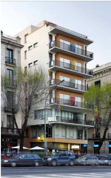
RRG_E_CAT_A16_01 contenido: vista exterior fecha de realización: 2007