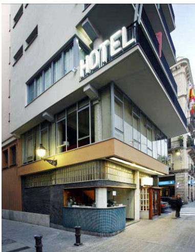
RRG_E_CAT_A16_02 contenido: vista exterior fecha de realización: 2007