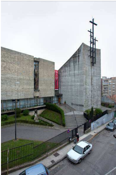
RRG_E_CANT_A09_05 contenido: vista exterior fecha de realización: 05/2010