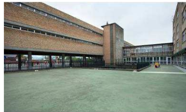
RRG_E_CANT_A09_07 contenido: vista exterior fecha de realización: 05/2010