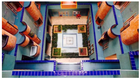
Fotograma de El amante bilingüe de Vicente Aranda / Imagen del edificio Walden 7 © Fundación DOCOMOMO Ibérico

Para más información de la sede del edificio Walden 7, visita los Registros de arquitectura moderna en la web de Fundación DOCOMOMO Ibérico: