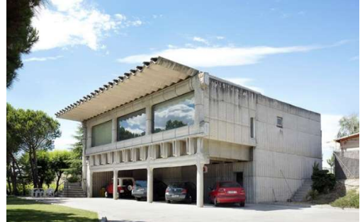
Fotograma del anuncio para El Estudiantes / Imagen de la casa estudio Fisac en Madrid

Para más información de la casa estudio de M. Fisac en Madrid, visita los Registros de arquitectura moderna en la web de Fundación DOCOMOMO Ibérico: