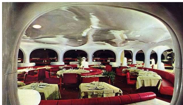
Fotograma de El Crack de J.L.Garci (arriba) y de Los límites del control (abajo) / Imagen de época del restaurante-comedor Ruperto de Nola