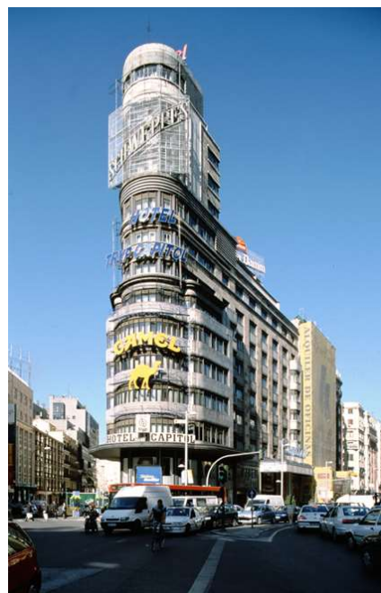
Fotogramas de El día de la bestia de Álex de la Iglesia / Imagen del edificio Carrión

Para más información del edificio Carrión, visita los Registros de arquitectura moderna en la web de Fundación DOCOMOMO Ibérico: