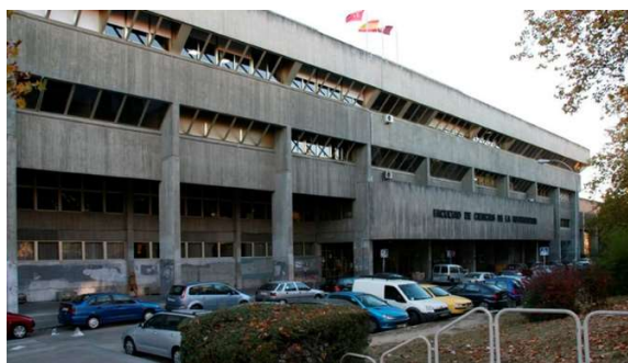
Fotograma de Tesis de A. Amenábar / Imagen de la Facultad de Ciencias de la Información de Madrid

Para más información de la Facultad de Ciencias de la Información de Madrid, visita los Registros de arquitectura moderna en la web de Fundación DOCOMOMO Ibérico: