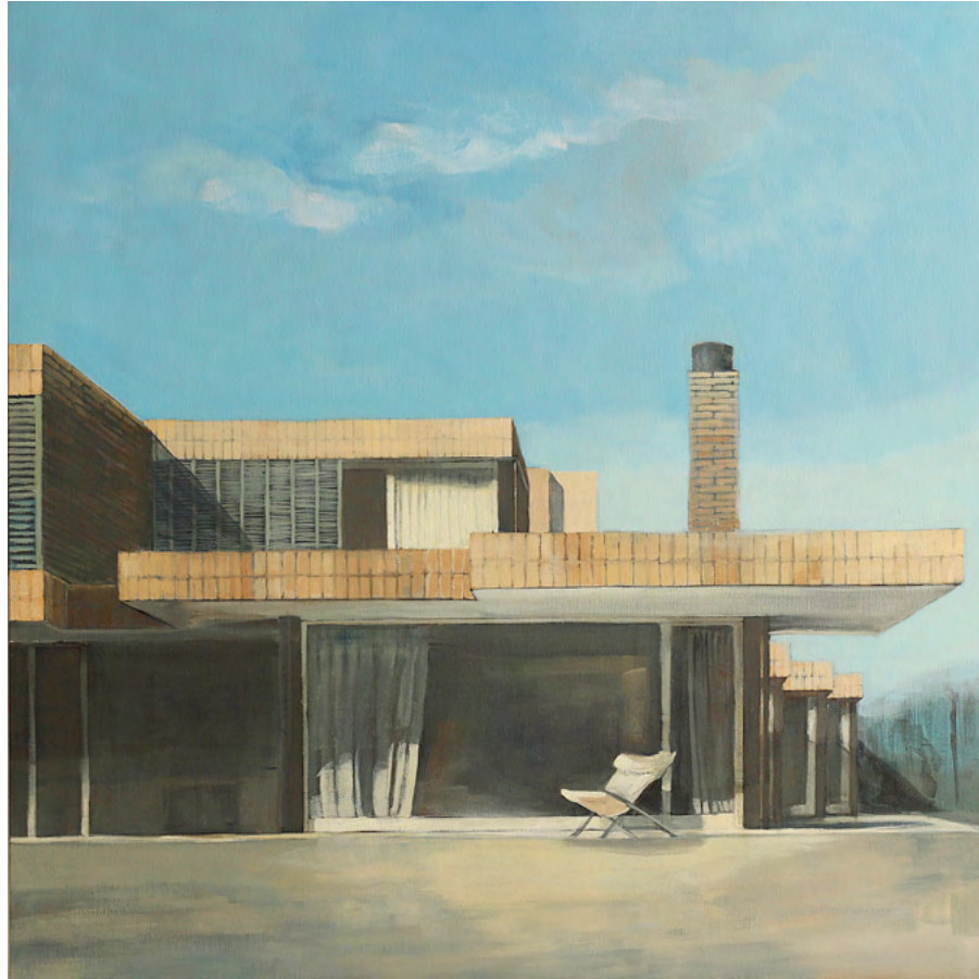
CASA G Y HAMACA Acrílico sobre tela, 100x100cm