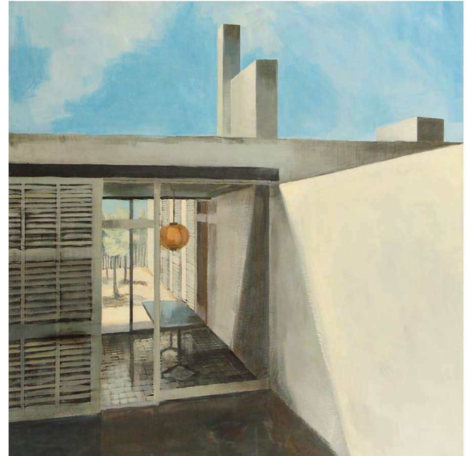
CASA C Y LAMPARA Acrílico sobre tela, 100x100cm