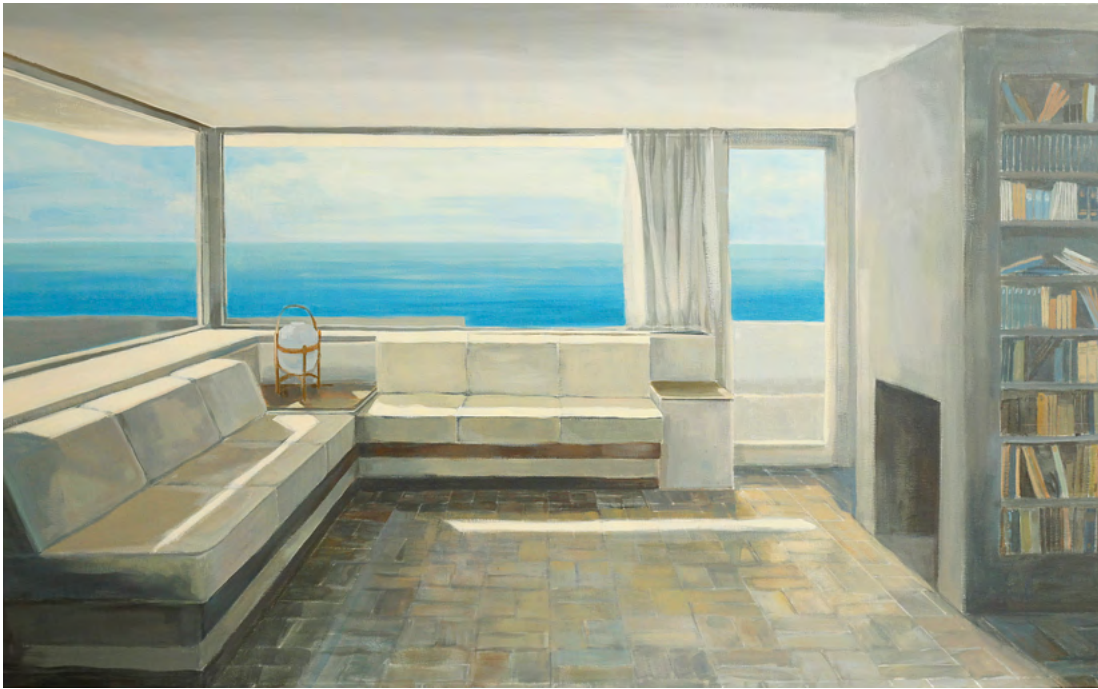
CASA R Y CESTA Acrílico sobre tela, 89x146cm