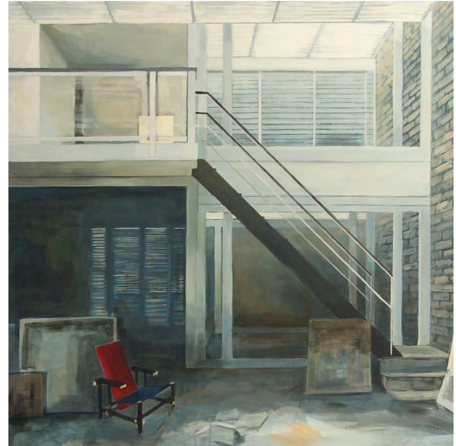
ESTUDIO T Y RIETVELD