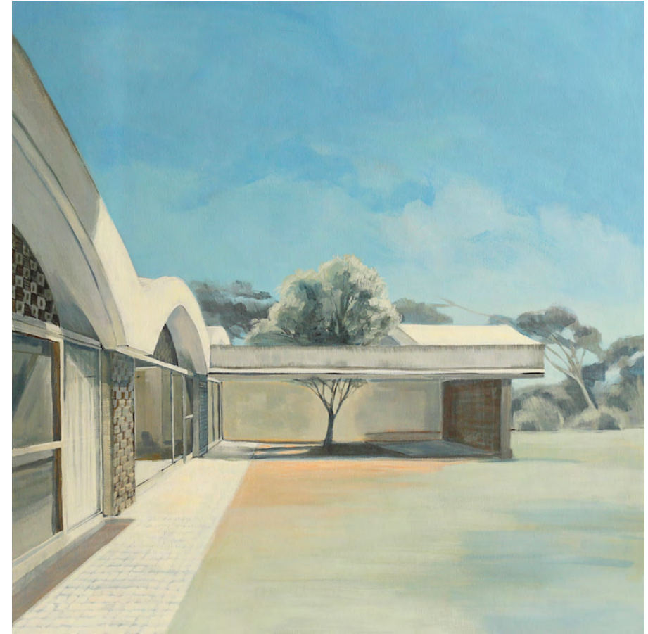
LA RICARDA Y OLIVO Acrílico sobre tela, 100x100cm