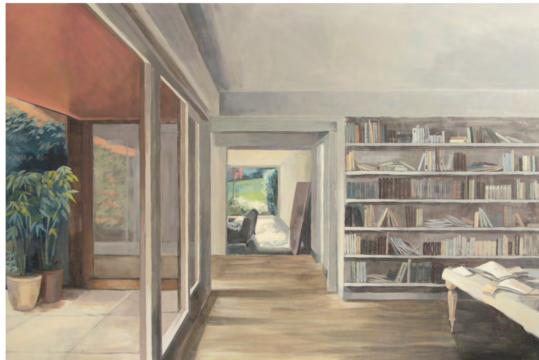
CASA E Y BIBLIOTECA Acrílico sobre tela, 130x195cm