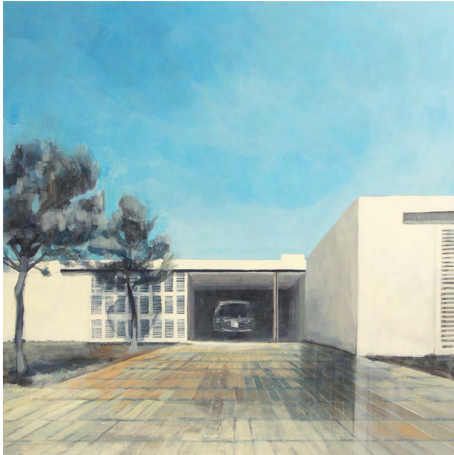
CASA G Y PINOS Acrílico sobre tela, 100x100cm