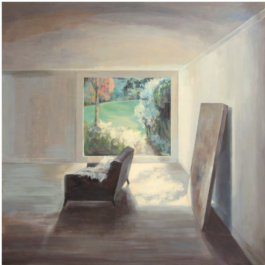
CASA E Y LLEO Acrílico sobre tela, 150x150cm