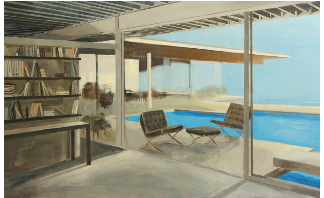
CASA N, LA PISCINA Y BARCELONA Acrílico sobre tela, 89x146cm