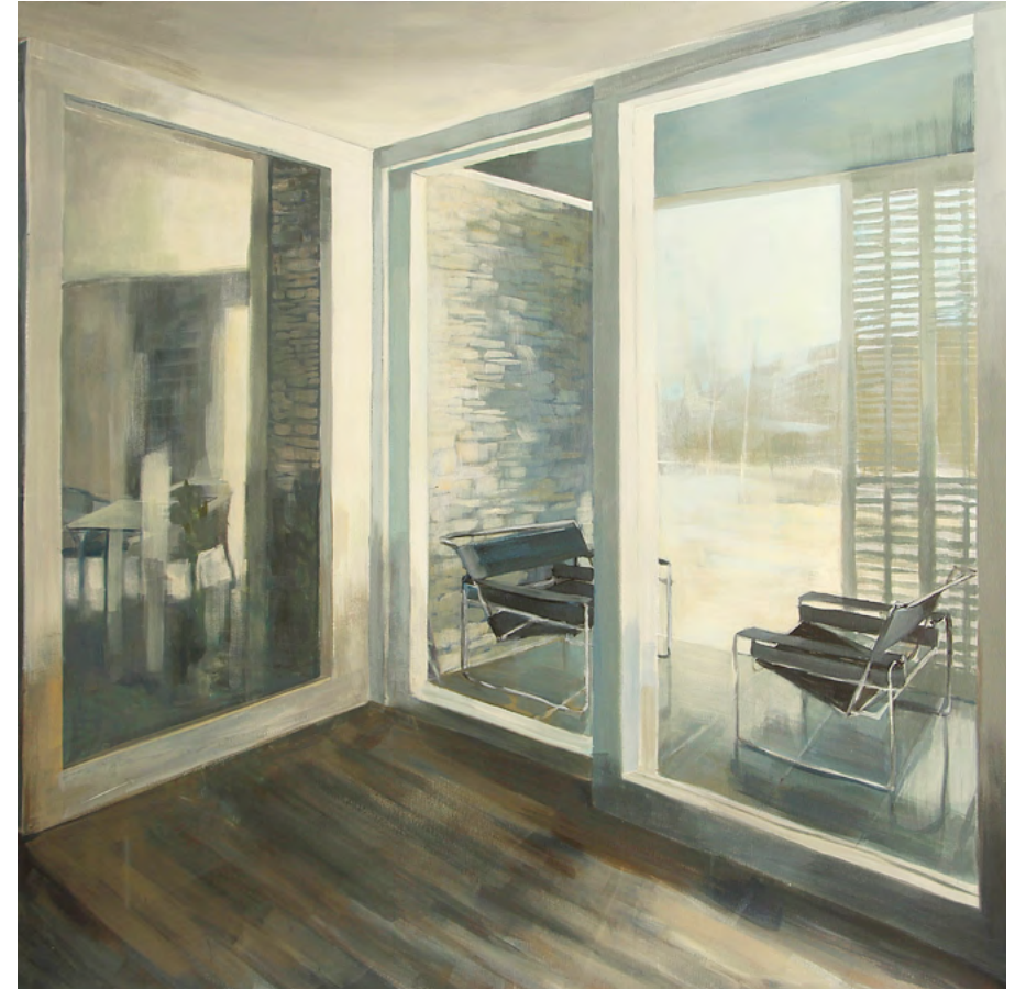
CASA B Y SILLAS WASSILY Acrílico sobre tela, 130x130cm