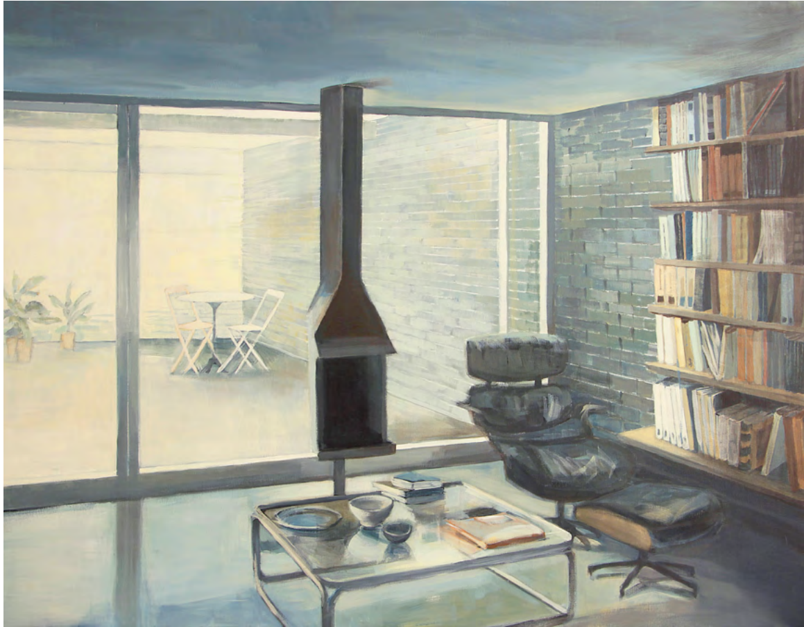
CASA T Y EAMES Acrílico sobre tela, 114x146cm