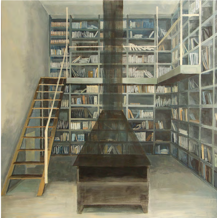
CASA T Y BIBLIOTECA