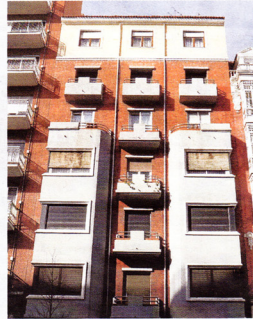
Edificio de viviendas CALLE GAMAZO, 22 ► Autor. Ramón Pérez Lozana. ► Fecha de construcción. Entre los años 1935 y 1940. Edificio de nivel B para la Fundación (Do.Co.Mo.Mo)