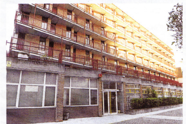
Colegio Mayor Santo Tomás ► Autor. Fray Francisco Coello de Portugal. ► Fecha de construcción. 1963.

fractura patrimonial que ha sufrido Valladolid a lo largo de su historia probablemente tan solo tenga comparación con las actuales fechorías alucinadas del Estado Islámico perpetradas contra monumentos de todo el territorio de Irak y Siria. Desarrabados. Arrasados. Pulverizados. En la ciudad condal, las desamortizaciones de Mendizábal, Espartero y Madoz, en el siglo XIX, hicieron desaparecer dieciséis relevantes cenobios musulmanes, incluido el impresionante convento de San Francisco, un solar formidable y colosal en pleno centro ciudadano. De los palacios cortesanos se encargó la