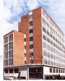
Edificio de sindicatos SEDE DE LA FEDERACIÓN VALLISOLE-TANA DE EMPRESARIOS, UGT Y CC OO ► Arquitecto. Julio González Martín. Situado en la calle Dos de Mayo con Divina Pastora. ► Fecha de construcción. 1959.