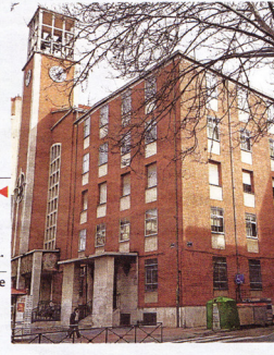
► Autor. Julio González Martín. ► Fecha de construcción. Entre 1951 y 1956. Equipamiento de nivel B.