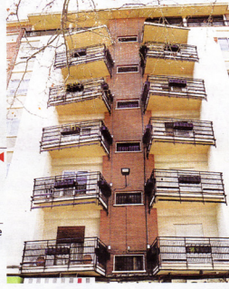
Edificio de viviendas CALLE ESPÍRITU SANTO, 1 ► Autores. Isaias de Paredes Sanz y Ángel Ríos Gómez ► Fecha de construcción. Entre 1958 y 1960. Nivel B.