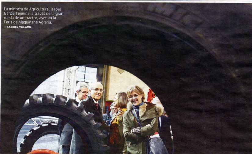
La ministra de Agricultura, Isabel García Tejerina, a través de la gran rueda de un tractor, ayer en la Feria de Maquinaria Agraria.

El déficit de la Seguridad Social se situará en el 1,5% hasta 2022, según prevé la Autoridad Independiente de Responsabilidad Fiscal. Las pensiones apenas subirán el 0,25%. p39