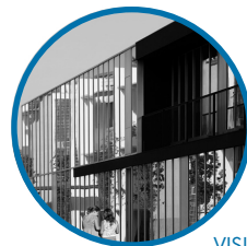
Escola Alemã 3 de Lisboa Otto Bartning [1961] Carrilho da Graça [2010]

Guided tour to the reference works of the modern and contemporary heritage of Lisbon [registration required].